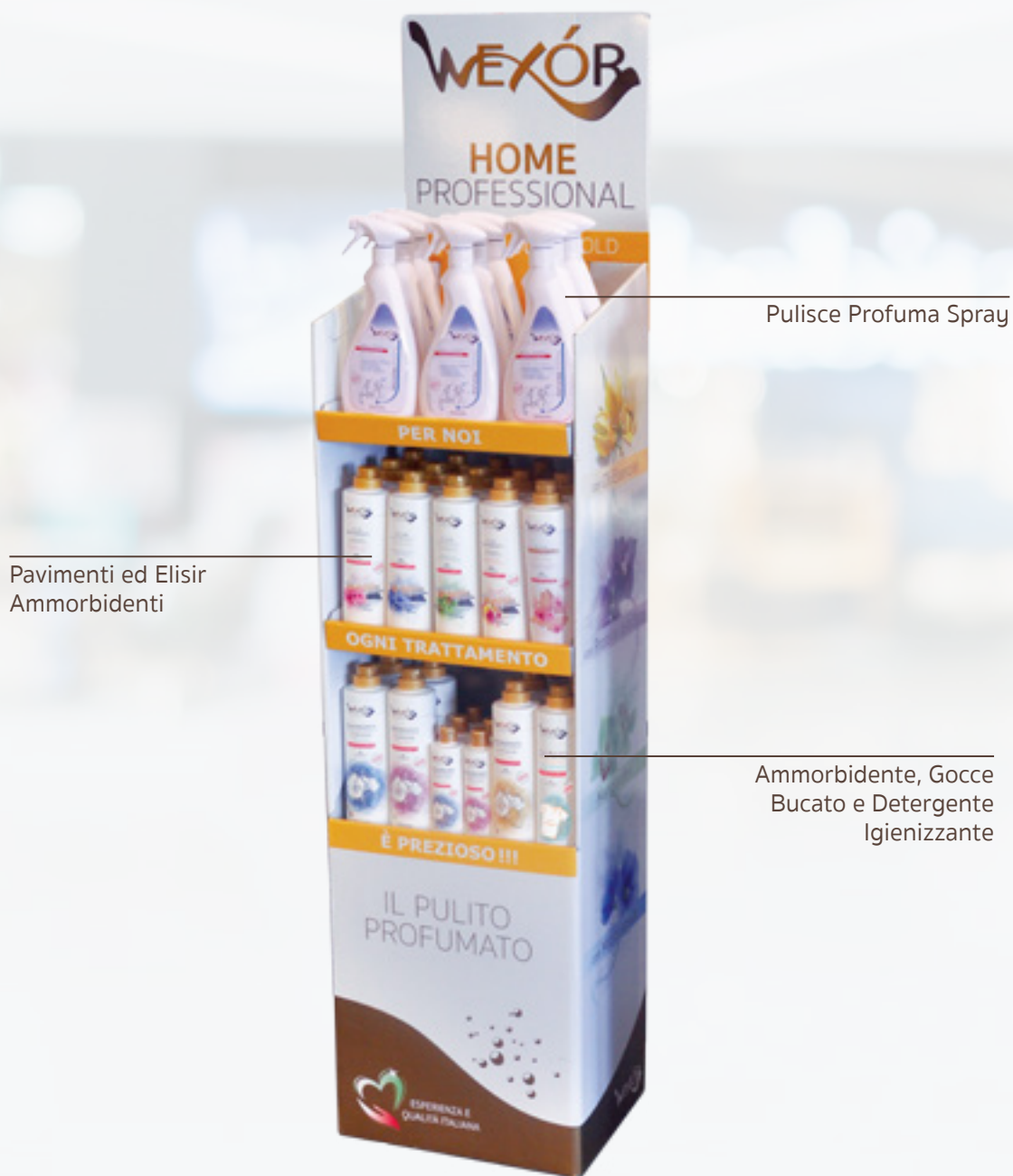
Pulisce Profuma Spray

Si tratta di espositori da terra in cartone preconfezionato, pratici e versatili, ideali per valorizzare i tuoi prodotti. Disponibili in un assortimento per ogni esigenza espositiva.